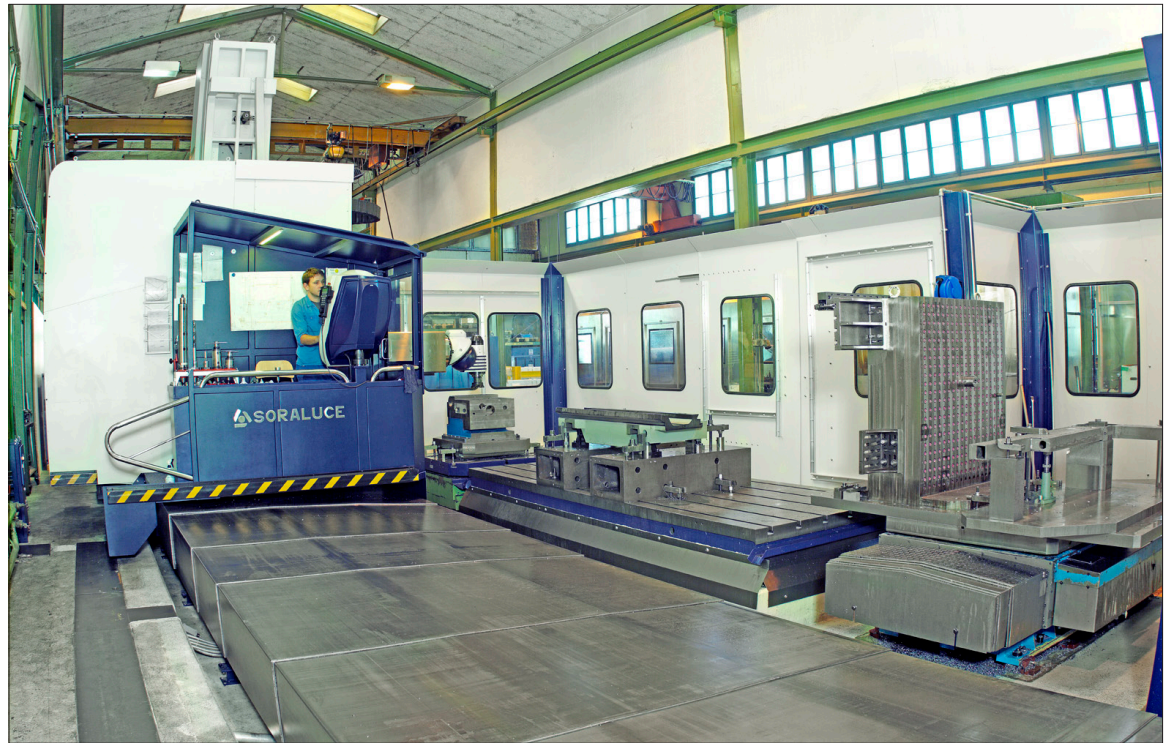
Lehner AG entwickelt, konstruiert, fertigt, montiert und wartet mit modernsten Mitteln für namhafte Kunden.

Weltklasse-Format. Wer mit Lehner AG zusammenarbeitet, verlangt und bekommt Hightech-Produkte für anspruchsvolle Sonderlösungen von hoher Komplexität inklusive Engineering.